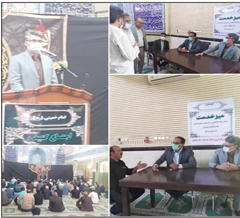
دهنده خدمات بهداشتی درمانی در اقصی نقاط شهرستان، به تشریح برنامه مدون

مدیر شبکه بهداشت و درمان شهرستان چرداول در بخش دیگری از سخنان خود به عملکرد و فعالیت های شبانه روزی کادر سلامت در مقابله با ویروس منحوس کرونا از جمله آموزش های فراگیر عمومی، تهیه محتوا و رسانه های آموزشی، رهگیری و مراقبت بیماری، واکسیناسیون کرونا و ... پرداخت و خواستار همکاری، هماهنگی بین بخشی و مشارکت حداکثری نهادهای سازمان ها و مردم شریف شهرستان در راستای دستیابی به پوشش حداکثری واکسیناسیون کرونا در تمامی رده های سنی بویژه کودکان ۵ تا ۱۲ ساله و شاخص تزریقی نوبت سوم واکسن کرونا شد.